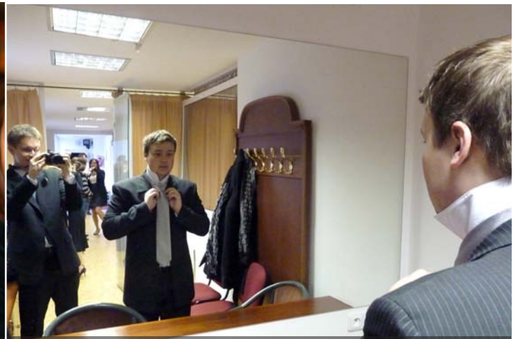
...s pečlivě uvázanými kravatami,