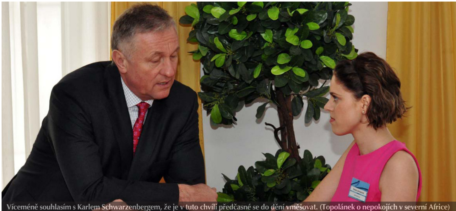
Víceméně souhlasím s Karlem Schwarzenbergem, že je v tuto chvíli předčasné se do dění vměšovat. (Topolánek o nepokojích v severní Africe)