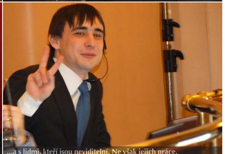
...a lidmi, kteří jsou neviditelní. Ne však jejich práce.