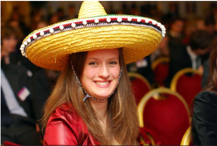
Součástí konference jsou cizokrajní diplomate,