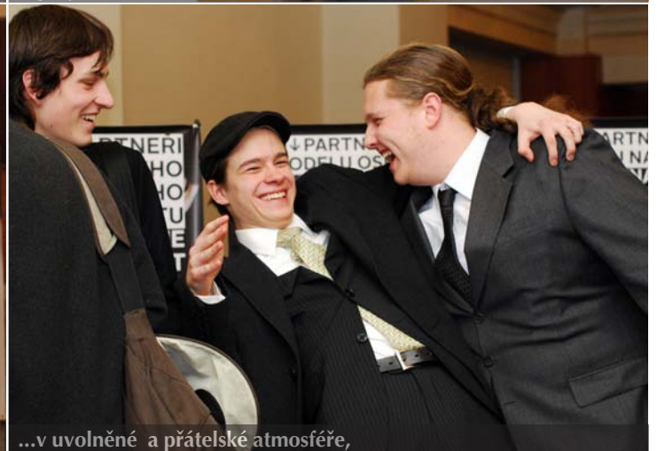
...v uvolněné a přátelské atmosféře,