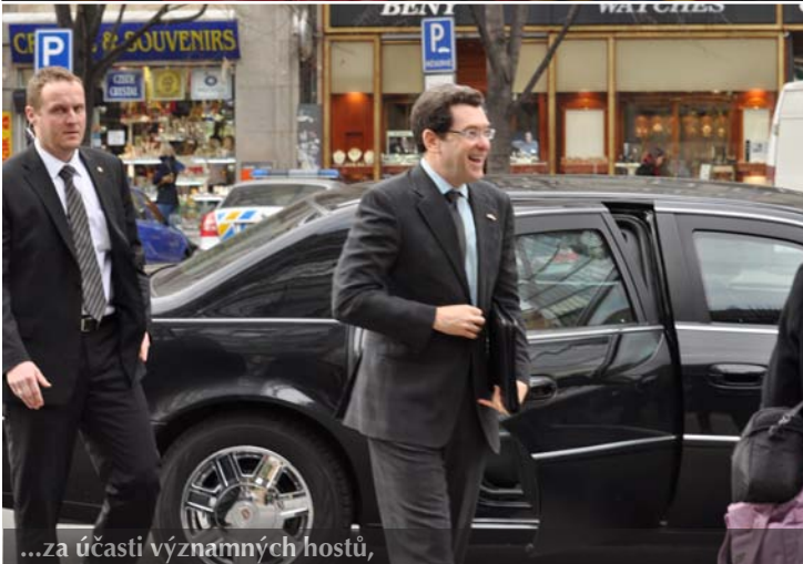
...za účasti významných hostů,