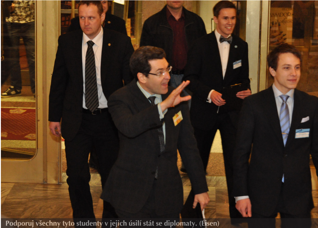
Podporuj všechny tyto studenty v jejich úsilí stát se diplomaty. (Eisen)