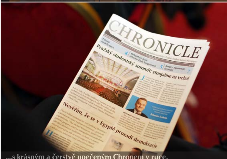
...s krásným a čerstvě upečeným Chronem v ruce,