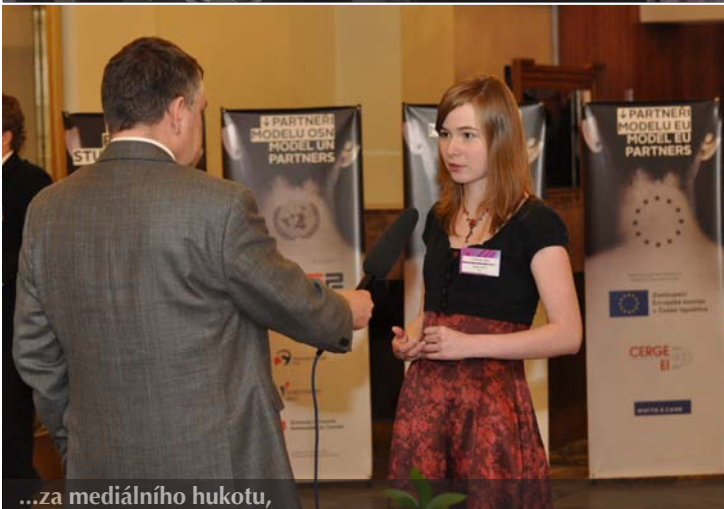
...za mediálního hukotu,