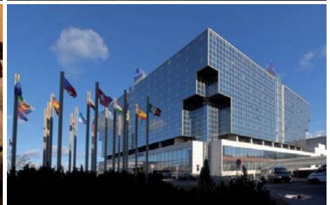
Ambassadors to Canada and the Czech Republic / Model Ambassadors to Canada and the Czech Republic