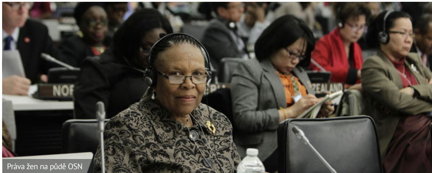
Práva žen na půdě OSN