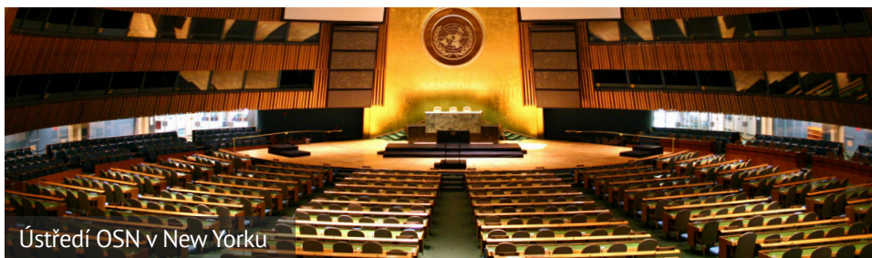
Ústředí OSN v New Yorku