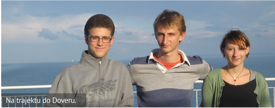
Na trajektu do Doveru.