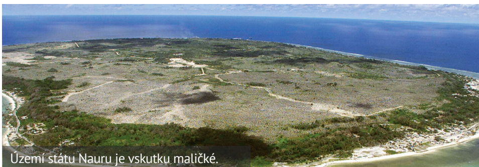
Území státu Nauru je vskutku maličké.