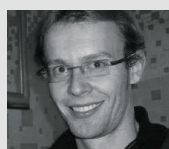
archiv T. V.

Chorvatská manažerka, která pracuje jako HR Business Partner u společnosti Microsoft. Specializuje se na oblast personalistiky, zvláště na oblast interního vzdělávání.