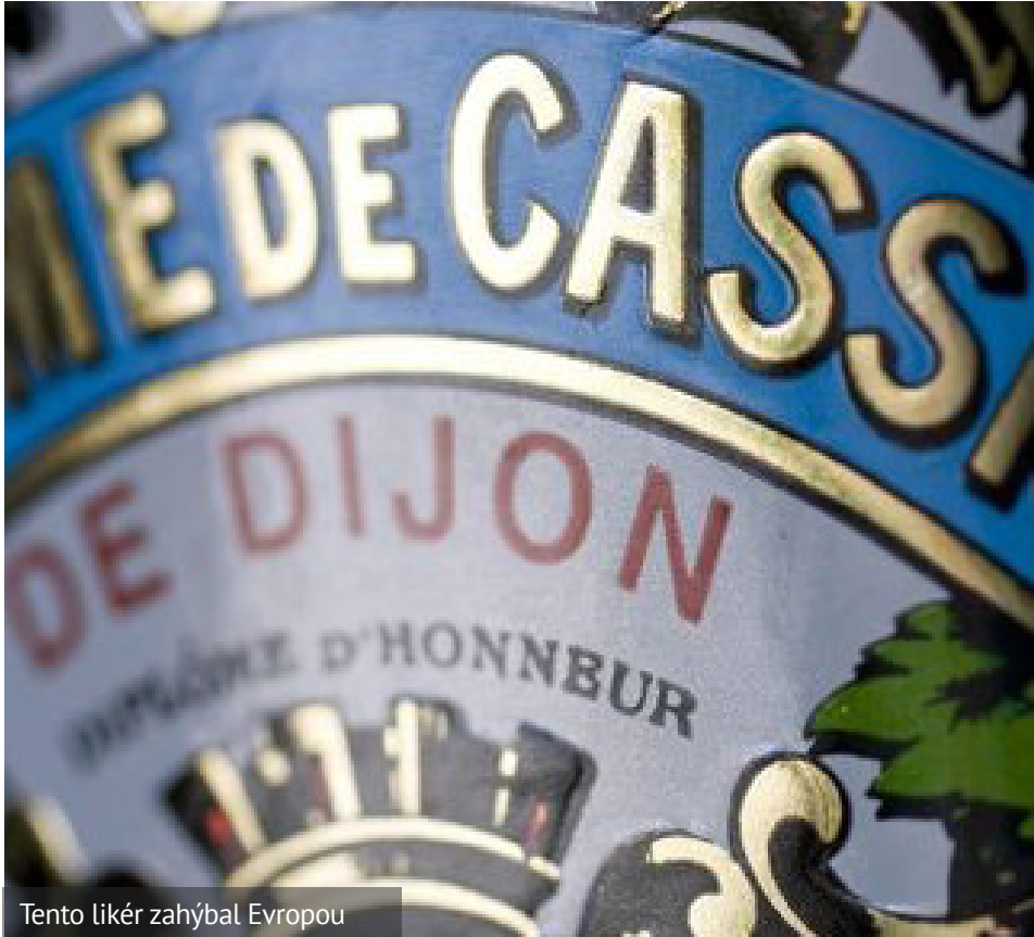
Tento likér zahýbal Evropou

Překážkami na cestě k jednotnému evropskému trhu nebyly pouze cla a kvóty, nýbrž také rozdílné požadavky členských států na kvalitativní vlastnosti dovážených výrobků. S odkazem na nesplnění řady vnitrostátních norem tak mohly jednotlivé země nadále komplikovat svobodný obchod. Historii změnil až slavný spor o francouzský likér Cassis de Dijon.