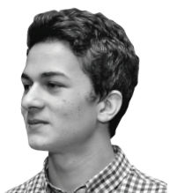
Vojtěch Hons delegát Pákistánu

Odstaňování obchodních bariér patří k jednomu z nejvýznamnějších cílů světového společenství. Jak se k tomuto zajímavému tématu staví dva delegáti ze Světové obchodní organizace (WTO), jedné z mezinárodních institucí, která má k tématu co říci?