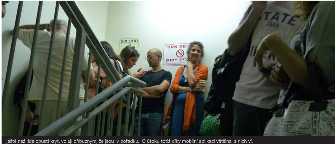
Ještě než lidé opustí kryt, volají příbuzným, že jsou v pořádku. O útoku totiž díky mobilní aplikaci většina z nich ví.

Můj soused vyskakuje ze své židle a utíká kamsi pryč. Ze všech rohů vybíhají muži z ochranky a zběsile mávají rukama, aby dirigovali onu děsivou němohru. Odhazují sluchátka a utíkám za ostatními. Všichni dobře vědí, o co se jedná. Hamas před třemi dny všechny turisty varoval před tím, aby se zdržovali na letišti v Tel Avivu. Plánuje ho totiž zničit..