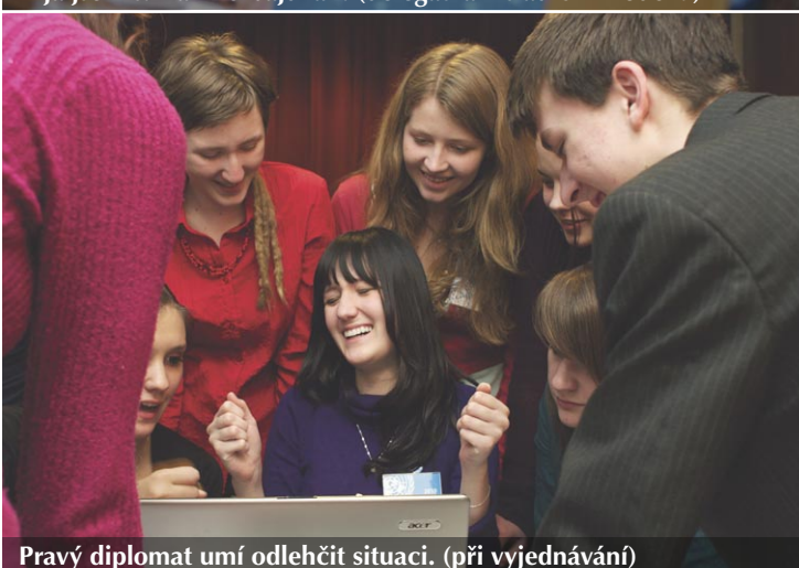
Pravý diplomat umí odlehčit situaci. (při vyjednávání)