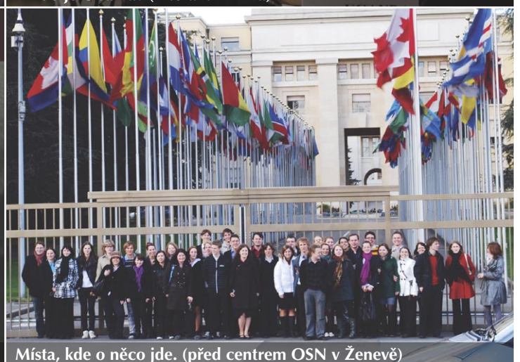
Místa, kde o něco jde. (před centrem OSN v Ženevě)