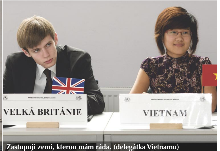
Zastupuji zemi, kterou mám ráda. (delegátka Vietnamu)