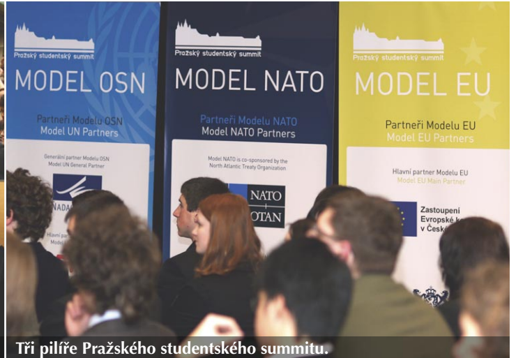
Tři pilíře Pražského studentského summitu.