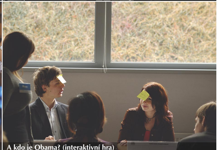
A kdo je Obama? (interaktivní hra)