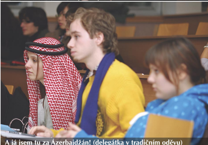
A já jsem tu za Ázerbajdžán! (delegátka v tradičním oděvu)