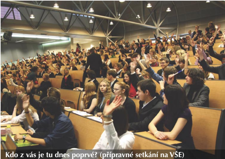
Kdo z vás je tu dnes poprvé? (přípravné setkání na VŠE)