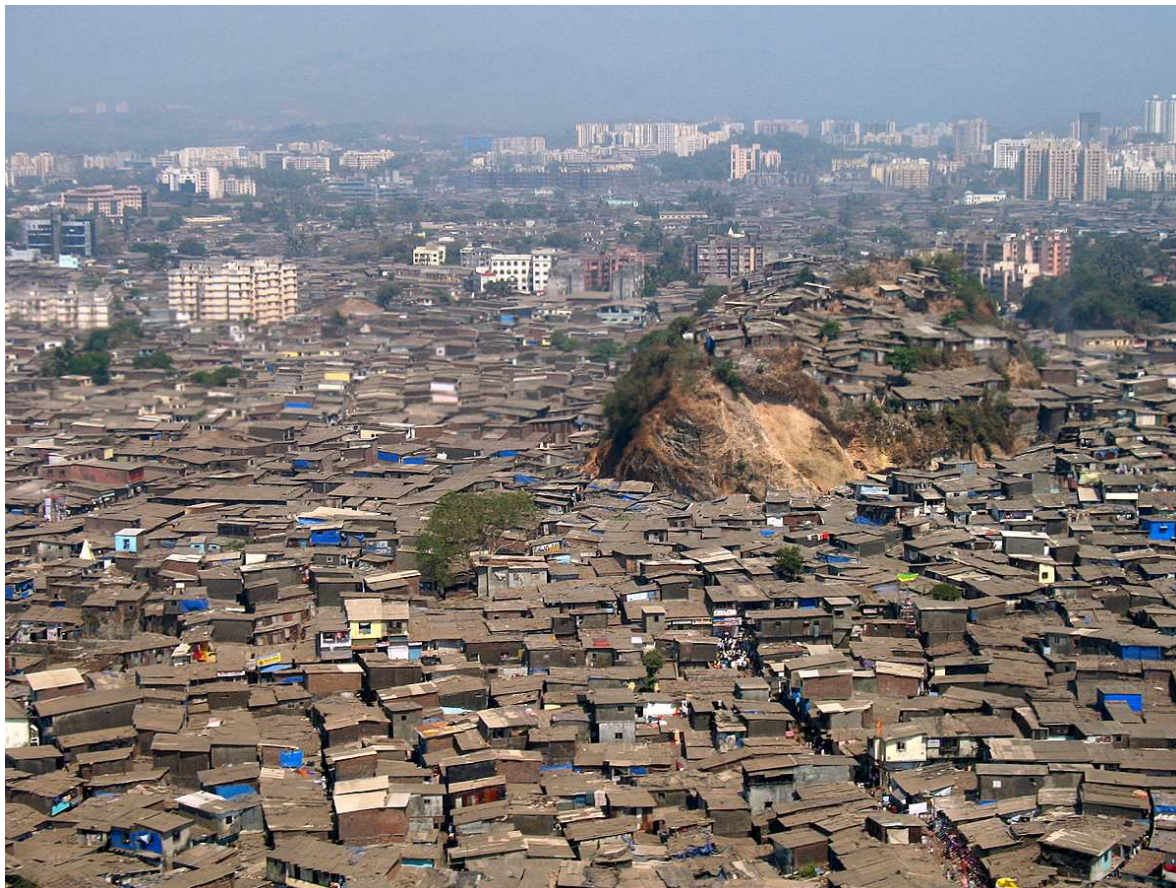
Slumy v indické Bombaji 4