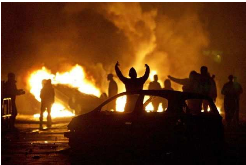
Nepokoje na předměstích Paříže roku 2007 8

Zatímco evropské státy se snaží k přistěhovalectví vybudovat nějaký konkrétní postup a způsob integrace, situace v USA se liší tím, že se jedná v podstatě o celý přistěhovalecký národ. Právě z toho vychází i různé teorie o integraci. Jedna z nich se nazývá „melting pot“ (tavící kotel) a hovoří o tom, že každý, kdo přijde do USA, se stane Američanem a „okoření“ tak stávající společnost. Druhá teorie je pojmenovaná „salad bowl“ (salátová mísa) a má charakterizovat směs jednotlivců různých etnik, kteří jsou pouze obsaženi v míse, která představuje Spojené státy. Pojmenování Američan je má pouze sjednocovat, zůstávají však osobitými entitami. Tyto dva typy jsou konkrétní ukázkou možných přístupů k chápání společnosti a integrace jako takové.