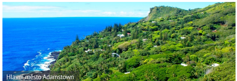
Hlavní město Adamstown

Zatímco vzpoura se stala jednou z nejslavnějších v dějinách mořeplavby a je námětem