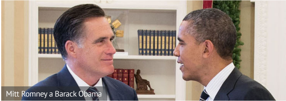
Mitt Romney a Barack Obama