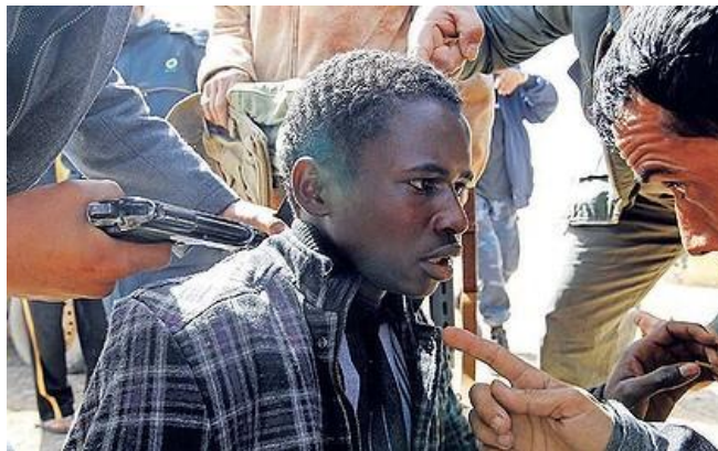
Obr. 4: Mladý zajatec z řad libyjských rebelů při výslechu.

Základním kamenem právní úpravy vnitrostátních ozbrojených konfliktů je společný článek 3 ŽÚ , který zakotvuje minimální humanitární minimum . To se vztahuje na všechny ozbrojené konflikty bez rozdílu. Článek 3 ŽÚ kromě obecného principu lidského zacházení bez diskriminace obsahuje také zákaz útoků na život a zdraví, zákaz braní rukojmí, zákaz útoků proti osobní důstojnosti a zákaz odsouzení a vykonání poprav bez předchozího rozsudku vyneseného řádným soudem. V roce 1977 byl přijat Dodatkový protokol II k Ženevským úmluvám 22 , který sice poskytuje podstatně komplexnější pravidla a ochranu, avšak vztahuje se pouze na tzv.