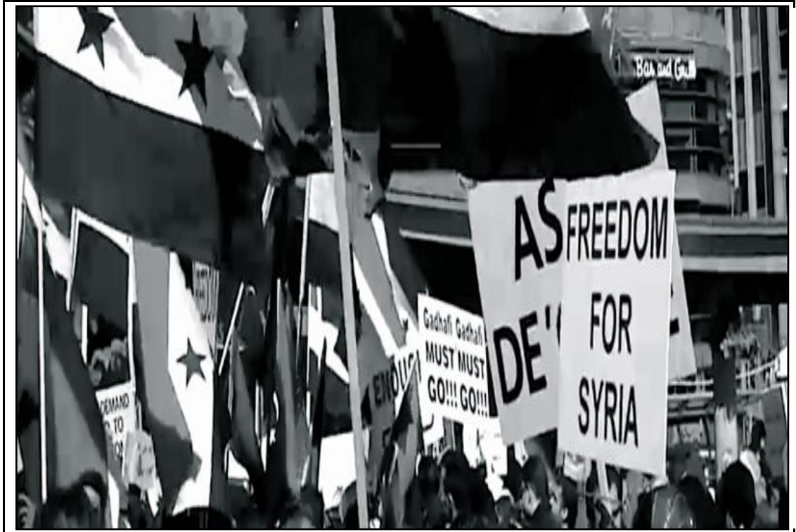
Obr. 5: Demonstrace v Sýrii v září 2011.

jelikož je na rozdíl od Sýrie jeho významným dodavatelem surovin. I když situace v Sýrii byla závažnější, pro vedení další války chyběla podpora veřejnosti a hlavně finanční prostředky.