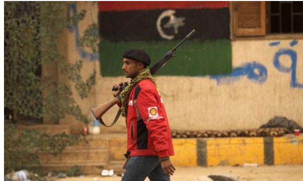
Obr. 3: Libyjský rebel v Bengháží.

Lidský život, zdraví a důstojnost patří k základním hodnotám moderní společnosti a jako takovým jim náleží patřičná právní ochrana. Ta může mít různé podoby.