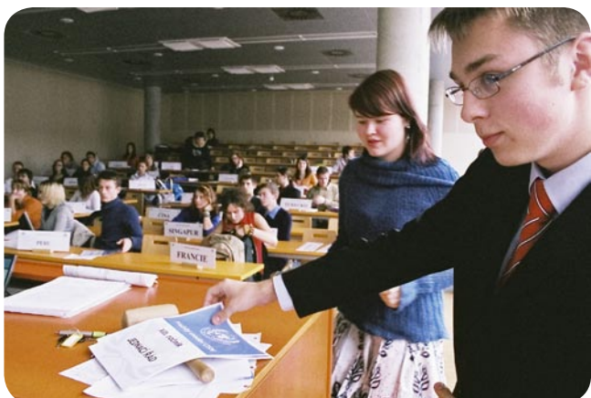
Jednací řád je žádané zboží.