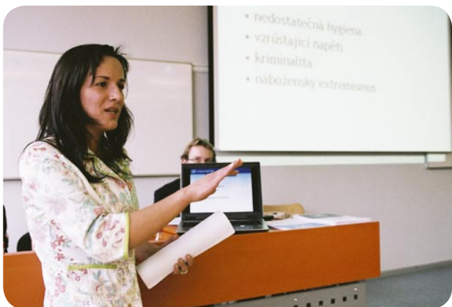
Šéfredartorka v akci...