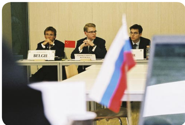
Ne, Čína o krizi v Keni jednat nebude.