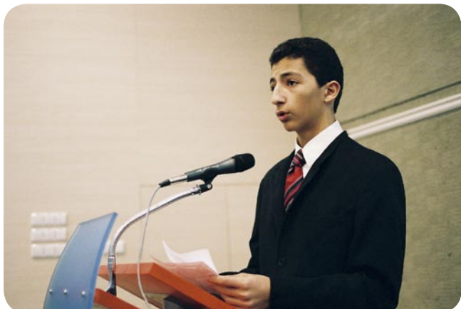
Za řečnickým pultíkem ...