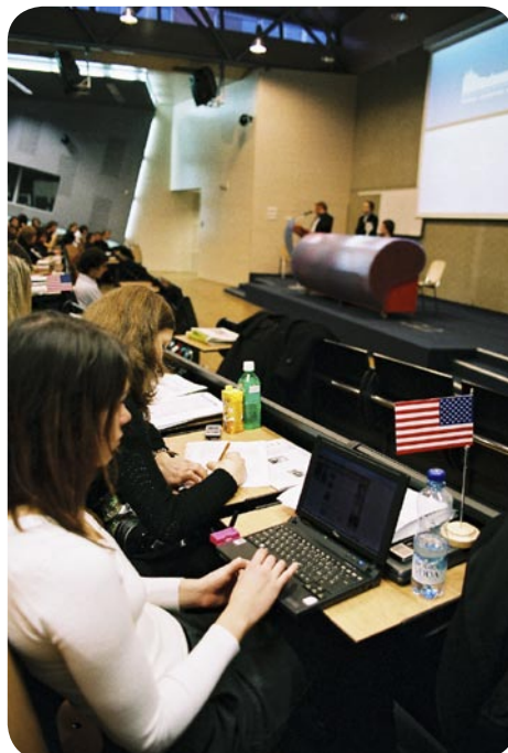
Online spojení s ambasádou je velmi důležité!