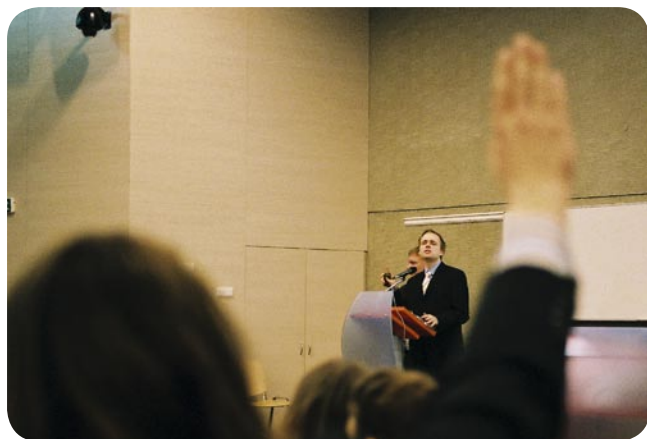
Já se chci zeptat ...