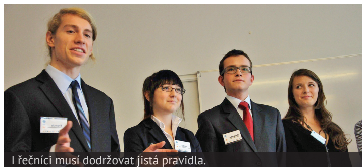
I řečníci musí dodržovat jistá pravidla.

Pražský studentský summit dnes již simuluje jednání tolika mezinárodních organizací, že není možné napsat článek o zdejších jednacích rádech tak, aby si půlka orgánů nepřipadala ukřivděně. Rozhodli jsme se proto nahlédnout na toto téma obecněji. Čtenáři se tak dozvědí, proč vůbec jednací řády máme, ale také jak je lze využít ve vlastní prospěch.