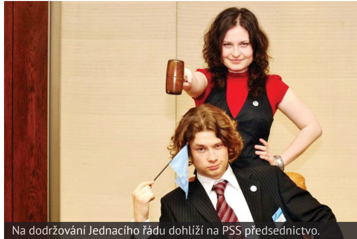
Na dodržování Jednacího řádu dohlíží na PSS předsednictvo.

Jak již bylo naznačeno, dobrý delegát by měl díky patřičné znalosti Jednacího řádu být schopen v kritických momentech využít pravidla ve svůj prospěch. „Existují triky, jak využít například měnící se většinu v sále. Ve vhodné chvíli pak lze rychle podat a schválit návrh,