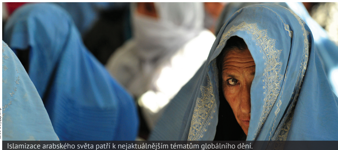
Islamizace arabského světa patří k nejaktuálnějším tématům globálního dění.

Po útocích z 11. září 2001 se začal opět hojně diskutovat Huntigtonův koncept střetu civilizací. O deset let později nastává vhodný okamžik na malé bilancování. Spojené státy a jejich spojenci se stahují z Iráku i Afghánistánu, Usáma bin Ládín byl zabit a (nejen) Blízký východ žije příběhem tzv. Arabského jara. Nejdůležitějším fenoménem dneška se zdá být „vzestup ostatních“, především Číny a Indie. Je optika střetu civilizací dobrý způsob, jak pohlížet na světové dění?