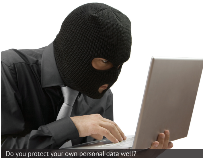
Do you protect your own personal data well?

World-wide connection makes long distance communication and data sharing much