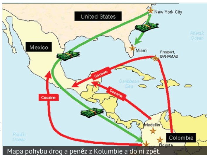
Mapa pohybu drog a peněz z Kolumbie a do ní zpět.

Ať už je příčina válek jakákoliv, vždy je nejvíce otnášeji obyčejní lidé. A v Kolumbii toto platí snad ještě více než kde jinde. Lze zde najít téměř všechny symptomy země, jež je válkou hluboce zasažená. Své domovy musely opustit více než čtyři miliony lidí, tedy každý desátý Kolumbijec. Jejich situace je pak o to tíživější, že zatímco mezinárodnímu uprchlictví je věnována alespoň elementární pozornost, tyto „vniřně přesídlené osoby“ jsou mezinárodním společenstvím takřka opomíjeny. Ztráty na lidských životech dosahují statisíců a pro obyvatelstvo venkova je ustavičná nejistota už téměř normálním stavem. Za-