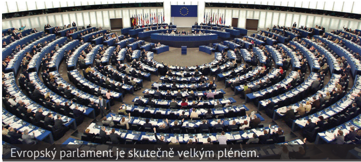
Evropský parlament je skutečně velkým plénem.

Parlament ČR přijímá dva druhy zákonů. Jedny podléhají politické a veřejné diskusi, druhé jen „transponují“ evropské směrnice. U nich je diskuse omezena, neboť požadavkům evropského práva je třeba vyhovět. Lze podobu těchto norem ovlivnit alespoň na půdě Evropské unie?