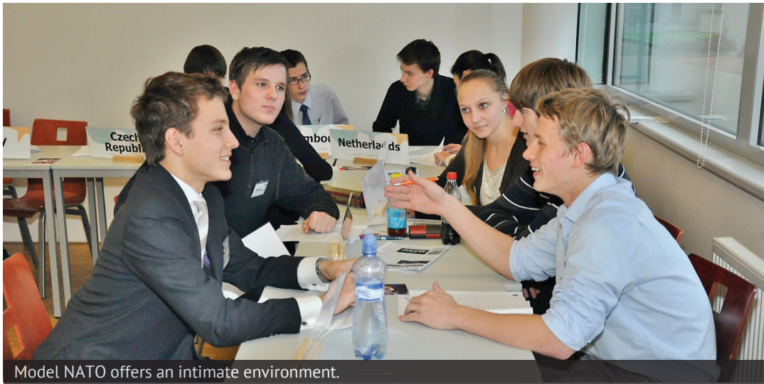
Model NATO offers an intimate environment.

During the second workshop the participants of Model NATO have finally transformed into the Ambassadors of NATO member countries. This time they did not have a joint program with Model UN, but instead gained specific knowledge about