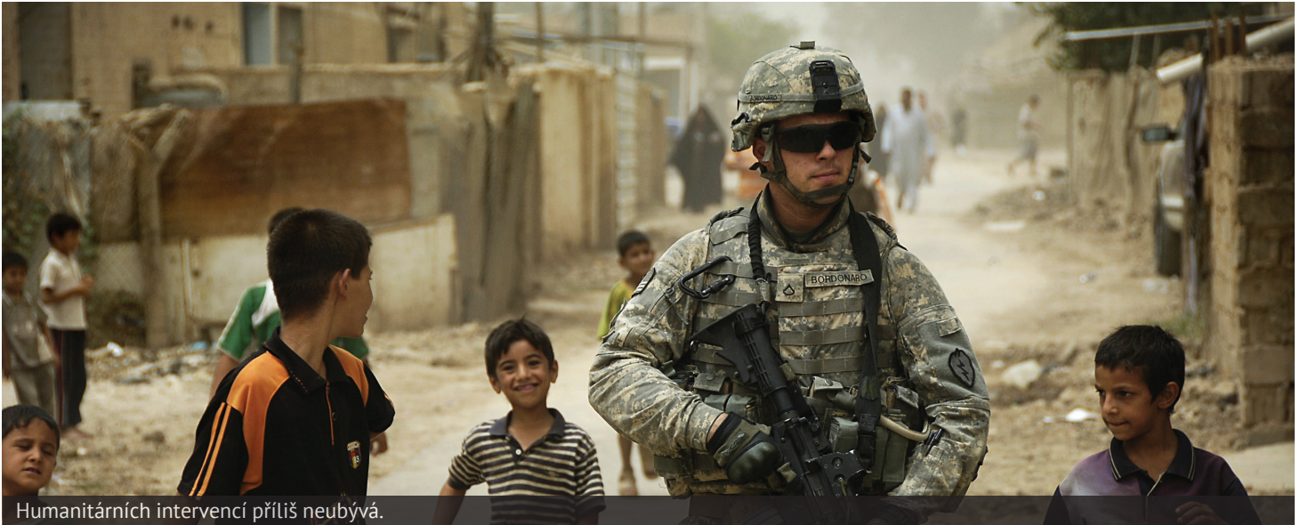
Humanitárních intervencí příliš neubývá.