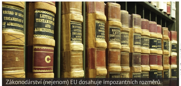
Zákonodárství (nejenom) EU dosahuje impozantních rozměrů.

Národní parlamenty mají po přijetí Lisabonské smlouvy pravomoc legislativu napadnout, pokud neodráží základní principy subsidiarity a proporcionality. Oproti dřívějšíku tedy sice svou pozici posílily, ale otázkou nadále zůstává je-