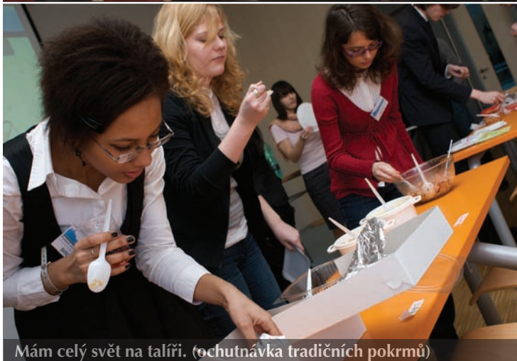
Mám celý svět na talíři. (ochutnávka tradičních pokrmů)