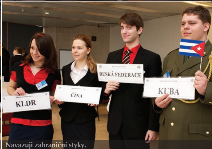
Navazuji zahraniční styky.