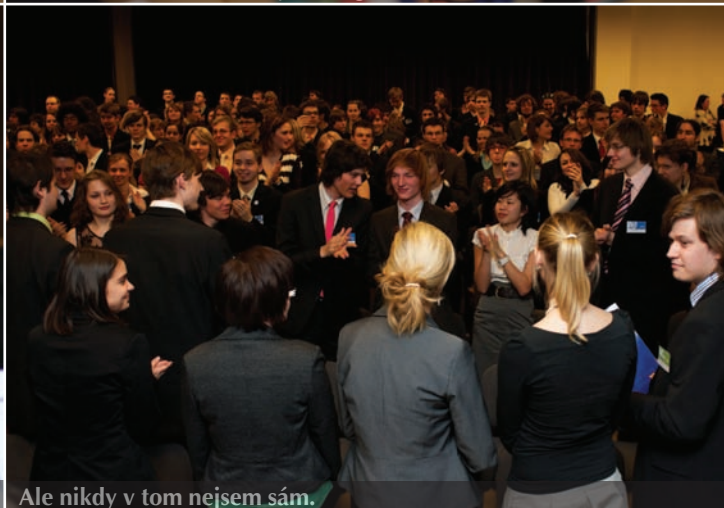
Ale nikdy v tom nejsem sám.