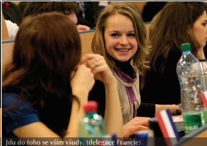
Jdu do toho se vším všudy. (delegace Francie)