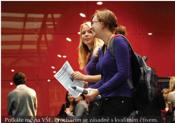
Potkáte mě na VŠE. Procházím se zásadně s kvalitním čtivem.