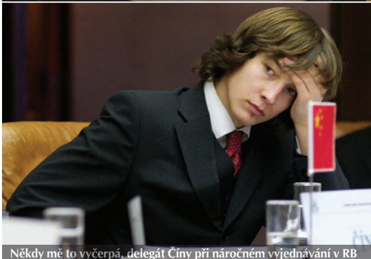
Někdy mě to vyčerpá, delegát Číny při náročném vyjednávání v RB