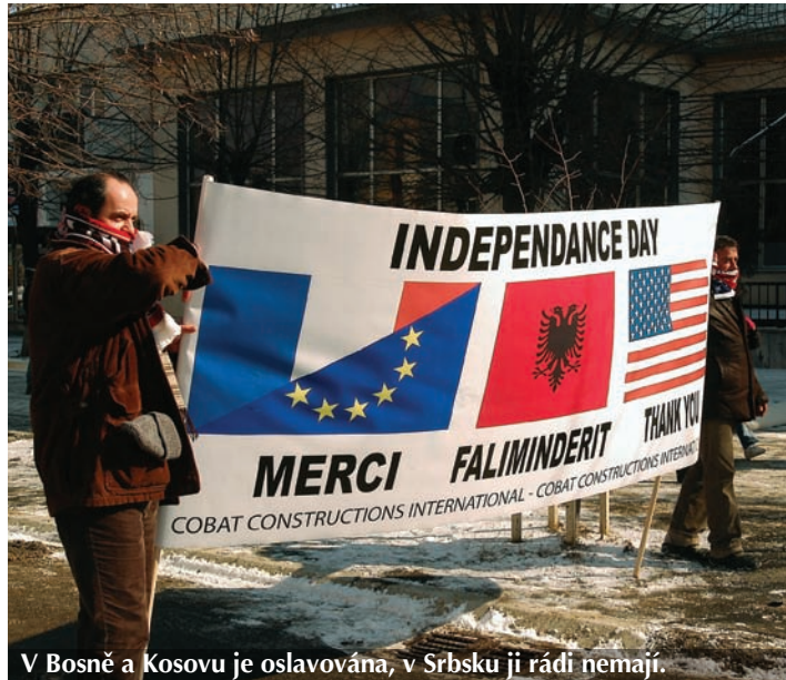
V Bosně a Kosovu je oslavována, v Srbsku ji rádi nemají.

mírových sil a jinou možnost nepřípouštěly. Ať už byl však její podíl na výsledném postoji USA v Radě bezpečnosti jakýkoli, Albrightová se později za nešťastné otálení omluví a nutno také podotknout, že poté, co jí ministerstvo zahraničí