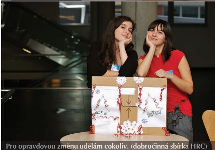
Pro opravdovou změnu udělám cokoliv. (dobročinná sbírka HRC)