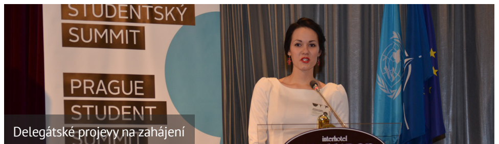
Delegátské projevy na zahájení