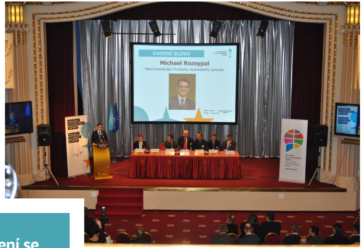
Zahájení se velmi vydařilo...