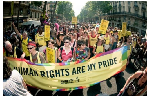
Obr. 4: Kampaň AI za práva homosexuálů.

International Lesbian and Gay Association 48 je federací velké řady lokálních a národních organizací, které se zasazují o práva osob LGBT. Velice cenné jsou její každoročně vydávané zprávy „Státem podporovaná homofobie“, které mapují kriminalizaci osob LGBT v jednotlivých zemích a související změny, ke kterým došlo. 49