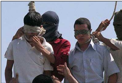
Obr. 3: Poprava homosexuálních mladíkův Íránu.