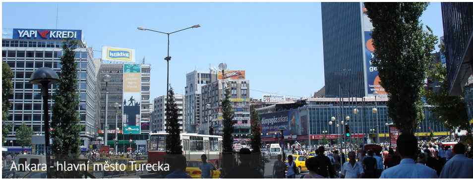
Ankara - hlavní město Turecka