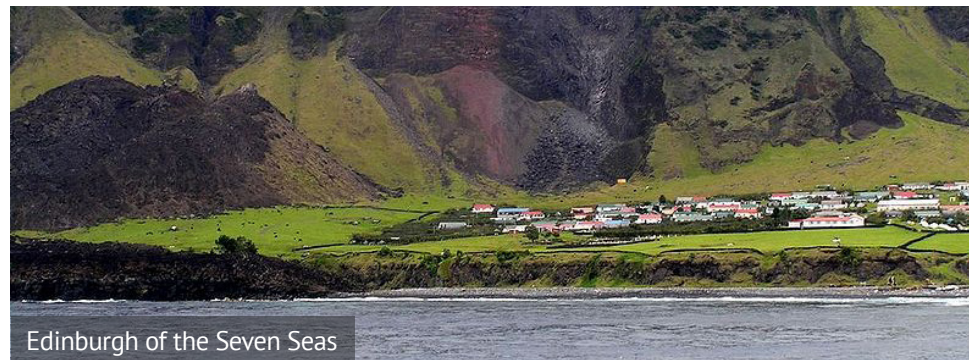
Edinburgh of the Seven Seas