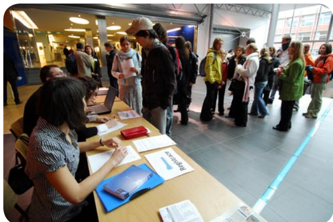
Ranní registrace - chcete mě?