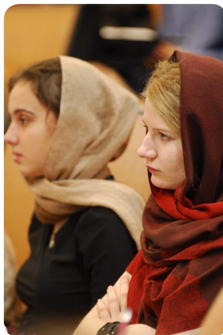
Delegátky, které nepodcenily přípravu.