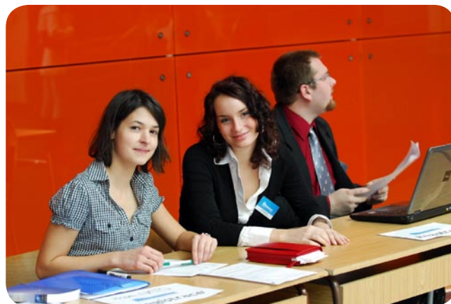
Okouzlující registrační tým.