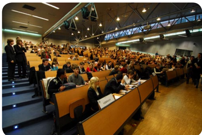
Za 5 minut začínáme...