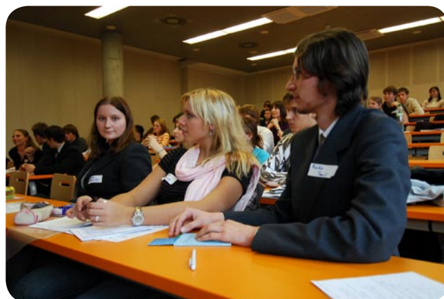
Jednání ve II.výboru.