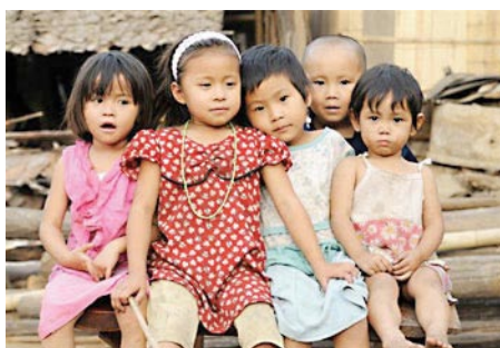
Ve skupině 23 uprchlíků z Barmy, kteří přiletěli do Prahy 30. října, byla i řada dětí.

Česká republika leží v samém srdci Evropy. Podobné věty uvádí každá turistická příručka ve snaze přilákat co nejvíce návštěvníků ze zahraničí. Málokdo si tuto informaci spojí s tím, že se tu zároveň nachází jakási křižovatka (nejen) evropských národů. To si uvědomíme třeba při otevření běžné středoškolské učebnice literatury. Zjistíme, že řada českých děl byla psána nejen česky, ale také latinsky, německy či hebrejsky – během staletí se zde vytvořilo multikulturní, byť konfliktní, společenství. To v důsledku tragických událostí 20. století zaniklo a dnes je český národ homogenním celkem. Můžeme polemizovat o tom, zda ono „etnické očištění“ přispívá současným xenofobním náladám, když začneme hovořit o uprchlících, migrantech, asimilaci a integraci. Tyto reakce jsou o to víc paradoxní, protože to byli lidé z českých zemí, kteří po staletí utkali z vlasti a hledali útočiště v zahraničí. Znáte přece osudy Jana Ámose Komenského (1628), Karla Havlíčka Borovského (1851), Jiřího Voskovce a Jana Wericha (1939) či Josefa Škvoreckého (1969).