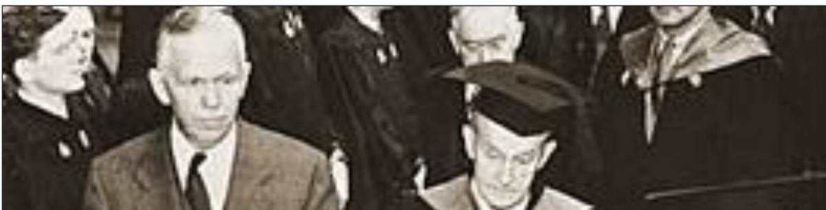
Obr. 1: Marshall na Harvardu (první zleva), 5. června 1947, několik okamžiků před pronesením jednoho z nejzásadnějších projevů 20. století,

Mezinárodní pomoc, tedy „mezinárodní přesun kapitálu, zboží nebo služeb ze země či mezinárodní organizace za účelem prospěchu příjmové země nebo její populace“ 2 , existovala v různých podobách a intenzitách již ve starověku. Za úplné počátky lze označit vzájemnou podporu států starých říší při přírodních katastrofách. V následujících staletích se tato podpora předávala mezi státy, jež spolu sdílely kulturní hodnoty či stejnou koloniální vlajku. Až do minulého století nevznikl žádný ucelený globální přístup k mezinárodní pomoci. Vše ale změnilo dvě světové války a jejich ničivý dopad na společnost a světové hospodářství. Zásadním milníkem se stal tzv. Marshallův plán z roku 1947, projekt finanční a materiální pomoci určený spojencům