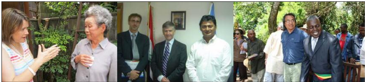
Obr. 4: Zvláštní zpravodajové během svých pracovních cest

Mandát zvláštního zpravodaje spadá v současné době pod kancelář Vysokého komisaře pro lidská práva pod tzv. „zvláštní procedury“. 36 Tam se řadí společně se zvláštním zástupcem Generálního tajemníka, tzv. nezávislým odborníkem a pracovními skupinami (Special Representative of the Secretary-General, Independent Expert, working groups). Rada pro lidská práva získává informace o jednotlivých zemích na základě korespondence s vládami. V případě větších nesrovnalostí a znepokojení se situací lidských práv na území daného státu, žádají po vládě vysvětlení. Pokud ani to není dostačující, požádají o povolení návštěvy zvláštního zpravodaje. Země mohou nabídnout Radě pro lidská práva i „stále pozvání“ 37 , což znamená, že jsou ochotni přijmout návštěvu od všech zpravodajů a expertů Rady. 38