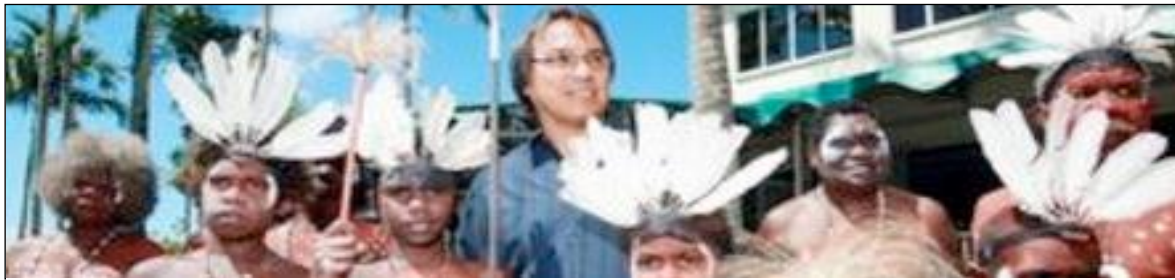
Obr. 5: James Anaya na pracovní misi v Austrálii

Ve své krátké historii však dosáhla instituce zvláštního zpravodaje OSN i nespočtu pozitivních výsledků. Jedním z těch nejviditelnějších v poslední době se stalo uzákonění práv domorodých obyvatel v Republice Kongo. Jedná se o první takovýto zákon přijatý v Africe a zároveň o obrovský krok k ochraně Pygmejů v této zemi.