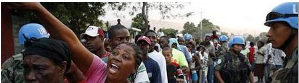
Obr. 3: Lidé čekající v řadě na materiální pomoc, Haiti

Jakými nástroji dosahuje ČR svých cílů? S ohledem na její množství finančních prostředků se zaměřuje v rámci bilaterální spolupráce na tzv. soft projekty, tedy projekty založené na předávání zkušeností a poznatků, nejčastěji ve formě stáží a studijních cest. Jsou realizovány také mikrogranty, umožňující start mladým neziskovým organizacím. Nicméně nejvýznamnějším nástrojem zůstávají dotace ze státního rozpočtu na roční či dlouhodobější projekty. Peněžní prostředky putují i z projektů spolufinancovaných Evropskou unií. Významnou roli hraje i podpůrná činnost daných zastupitelských úřadů ČR 24 . Jak již bylo výše uvedeno, Česká republika tedy svou transformační politiku realizuje díky svým zahraničněpolitickým